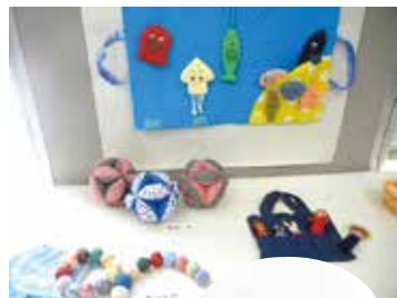
講演会にて手作りおもちゃ展示

社会環境が変わっても健全な家庭環境に変わりはありません。平凡な日々の生活の営みの中で、母親が心を込めて用意した食卓、清潔で気持の良い衣服や住居、堅実な家庭経済などを大切に考え、年代を超えた交わりの中で家庭経営の柱となる衣食住の考え方や技術、時間の使い方、予算のある家計簿記帳など明るく楽しく学びあっています。夏冬には友愛セール、秋には家事家計講習会を開催しています。