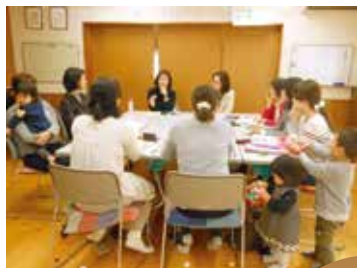
乳幼児グループ「のびのび」